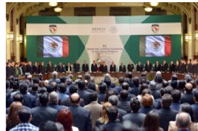
XL SESIÓN DEL CONSEJO NACIONAL DE SEGURIDAD PÚBLICA

MUCD en su intervención procuró darle seguimiento al planteamiento que le hicimos a la SSP-CDMX consistente en aprovechar más y ciudadanizar los sistemas de videovigilancia que tanto le han costado a los ciudadanos y que no se aprovechan para fortalecer sus denuncias; y como segundo tema se habló del acoso sexual en espacios públicos y el transporte , contextualizando ambas propuestas en el marco de la Cultura de la Legalidad, con el propósito de darle continuidad e insistir en la próxima sesión hasta materializar medidas de aplicación nacional. Además, en agosto participamos en la XL Sesión del Consejo Nacional de Seguridad Pública .