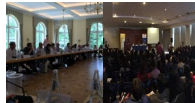
FOROS: ALEMANIA Y ECUADOR