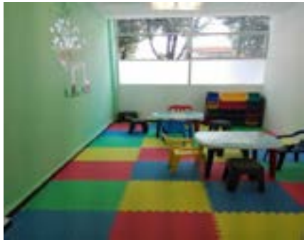
ÁREA LÚDICA DE LA AGENCIA DEL MINISTERIO PÚBLICO ESPECIALIZADA EN DELITOS SEXUALES, ÁLVARO OBREGÓN 2.

Como resultado de las propuestas realizadas en los reportes mensuales derivados de la aplicación de encuestas de percepción ciudadana, la Fiscalía Central de Investigación para la Atención de Delitos Sexuales se dio a la tarea de acondicionar en cada una de las Agencias del Ministerio Público Especializadas en Delitos Sexuales áreas lúdicas con el objetivo de resguardar a los niños, mientras los padres o familiares denuncian. Hasta el momento, una de 6 Agencias adscritas, ya cuentan con esta área.